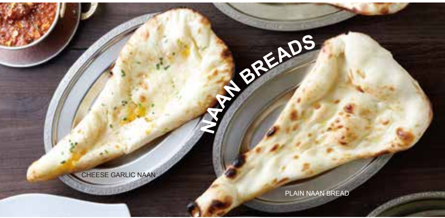
CHEESE GARLIC NAAN

Delivery orders are subject to minimum order of ¥ 5000. Below minimum order delivery charges of ¥ 1500 applicable. We deliver only in hirafu area and nearby locations. Garnishing might change because of packaging system. Prices are subject to 8% government taxes.